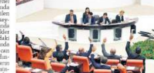
TBMM gece gündüz çalışarak yeni torba yasasının maddelerini kanunlaştırdı. Başkanlığı kaldırıldı.

Özeti Özet! Türkiye, Çin'in pek çok ortak özelliği vardır, birbirinden öğeneceği ve paylaşacağı çok şey var!.