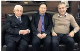
Sonra da yemerkörünün tadı damağında kalacak memleketine uğurladık...

Çin'e ilgili konularında o kadar çok soru vardı ki hepsini samimiyetle cevapladı.