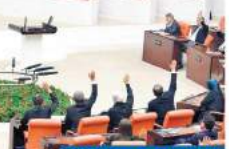
TBMM gece gündüz çalışarak yeni torba yasasının maddelerini kanunlaştırdı. Başkanlığı kaldırıldı.